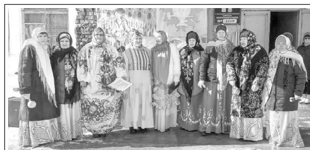
Коллектив «Рябинушка» КДЦ села Мосты - постоянный участник сельских праздников.

В Мостовском сельском Доме культуры богатый, разнообразный костюмерный фонд постоянно обновляется. Костюмы, парики, головные